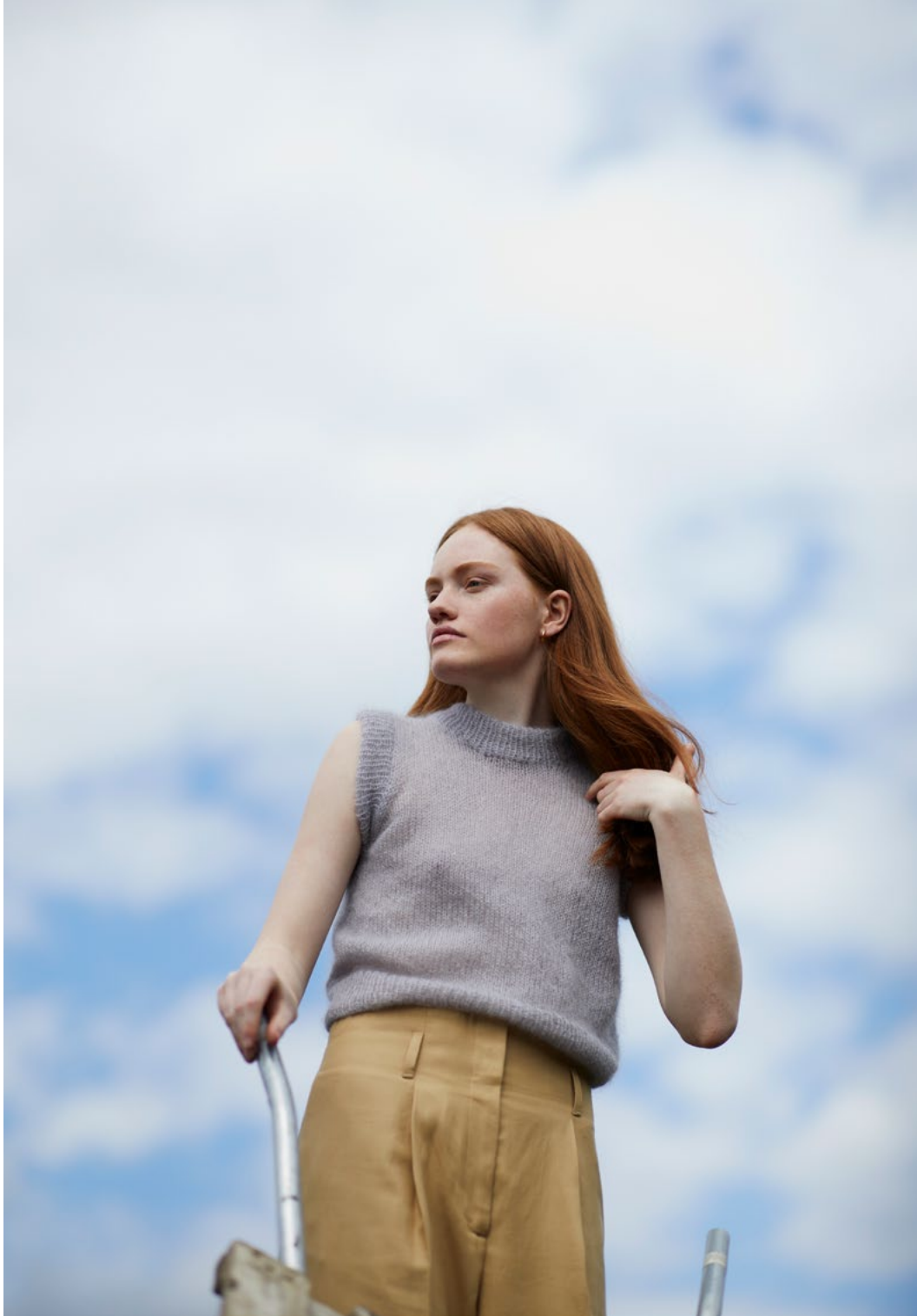
3 Sofiavest Plum lys grå 057