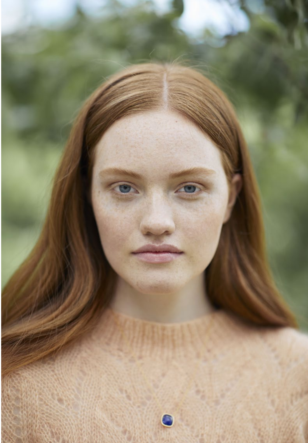
2 Fionagenser Plum lys fersken 019