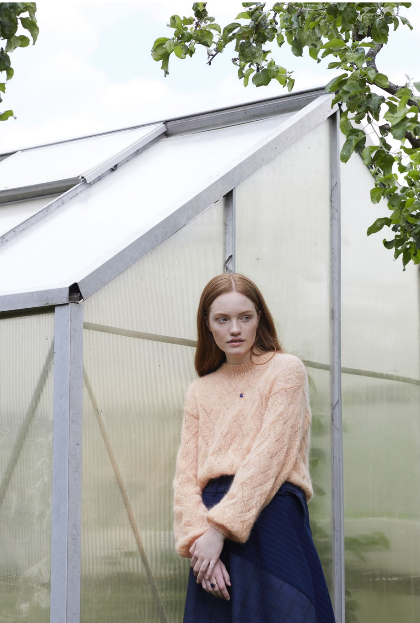
2 Fionagenser Plum lys fersken 019