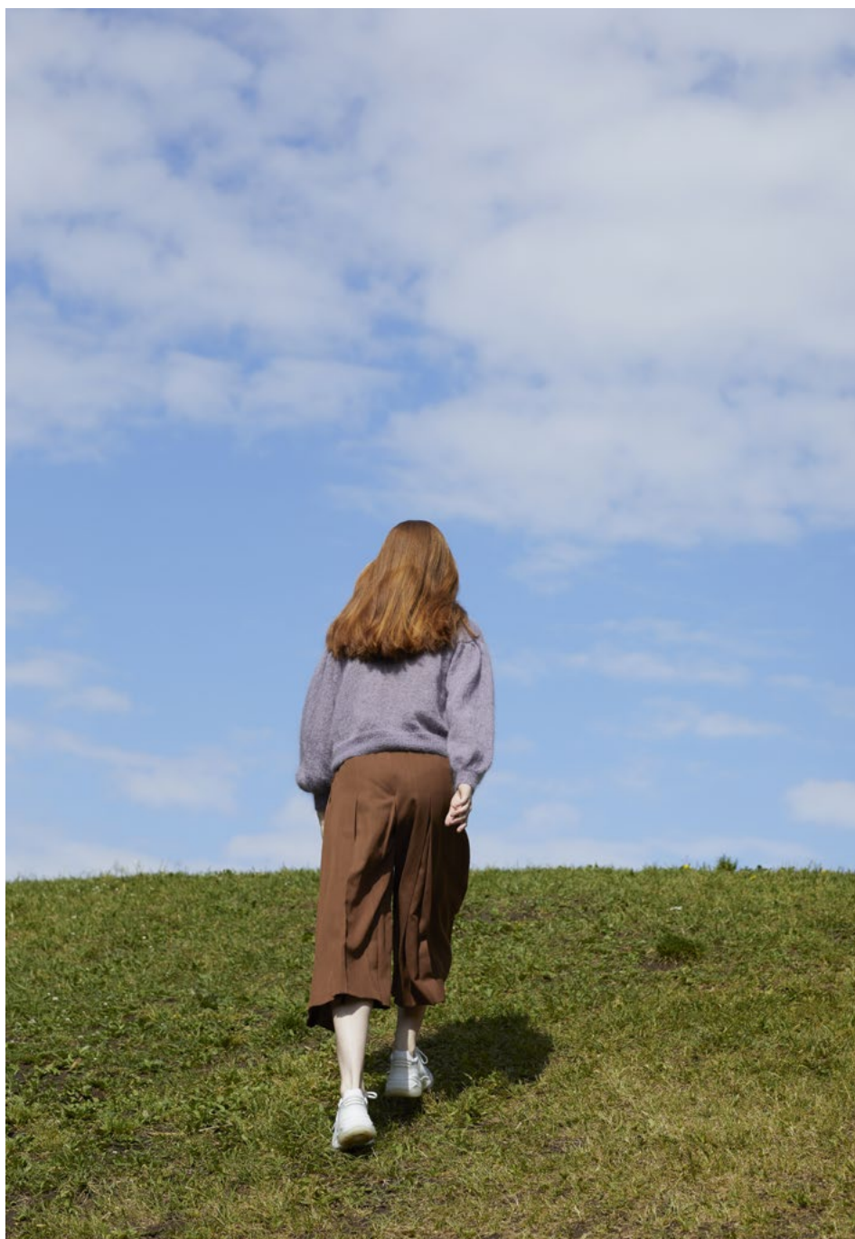
1 Celinegenser Plum lilla 048

Rauma Ullvarefabrikk AS 6310 Veblungsnes +47 71 22 05 00 post@raumau.no www.raumagarn.no #raumagarn