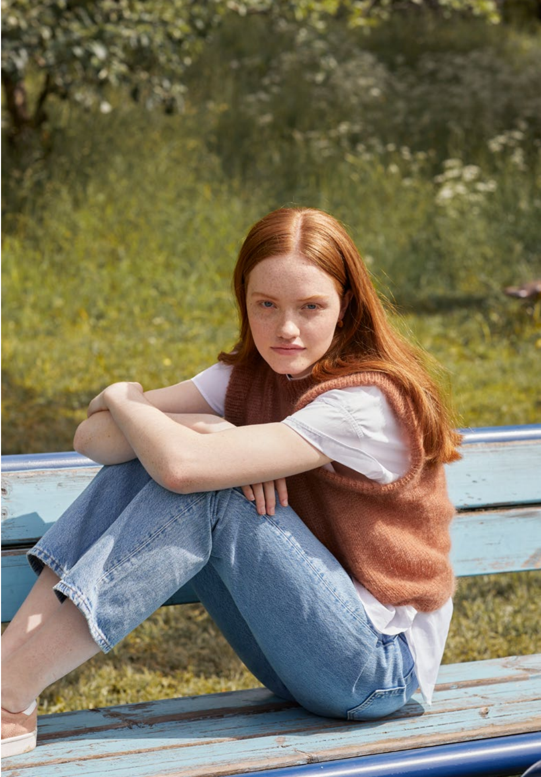
3 Sofiavest Plum brun 033