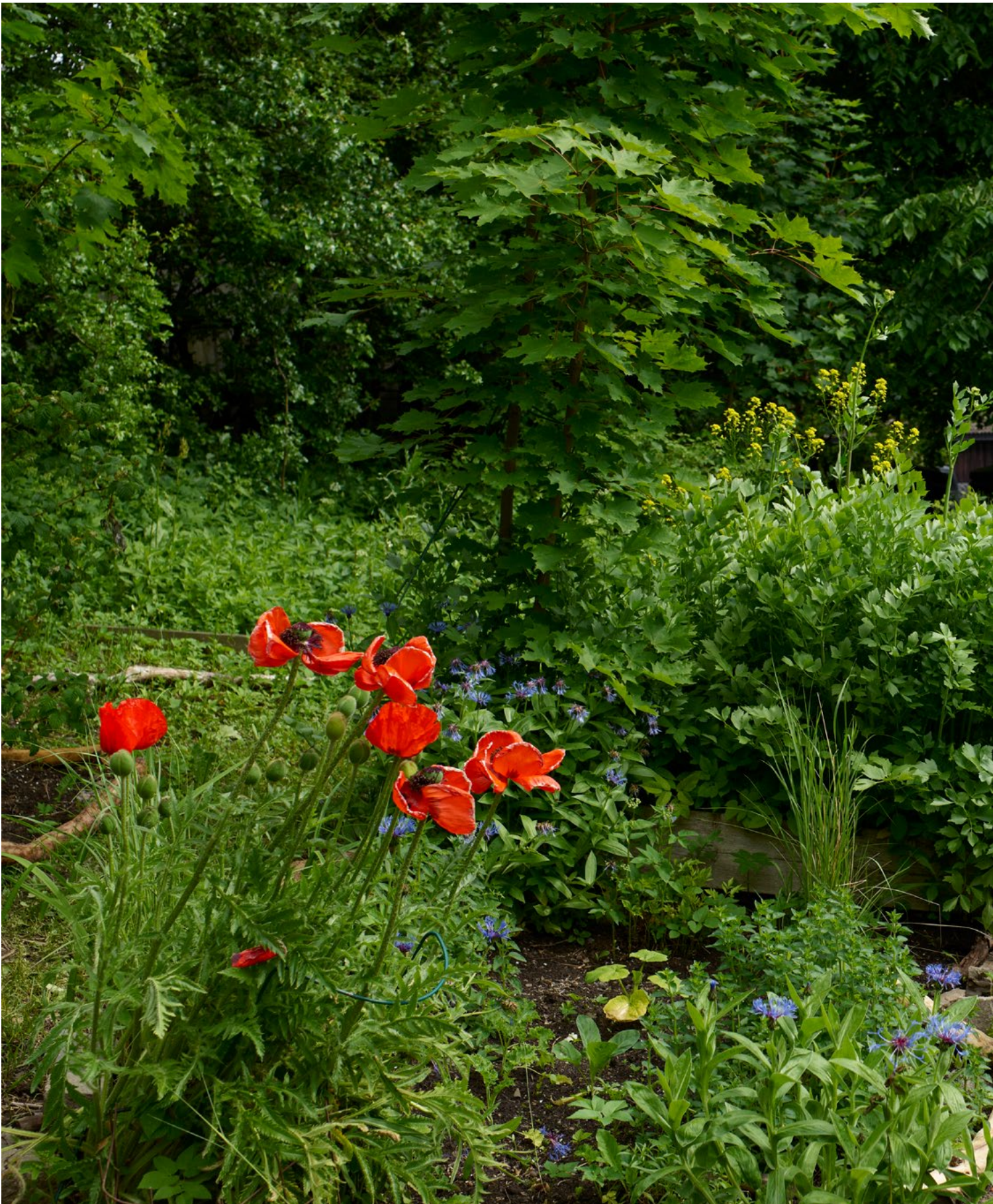
1 Celinegenser Plum lilla 048