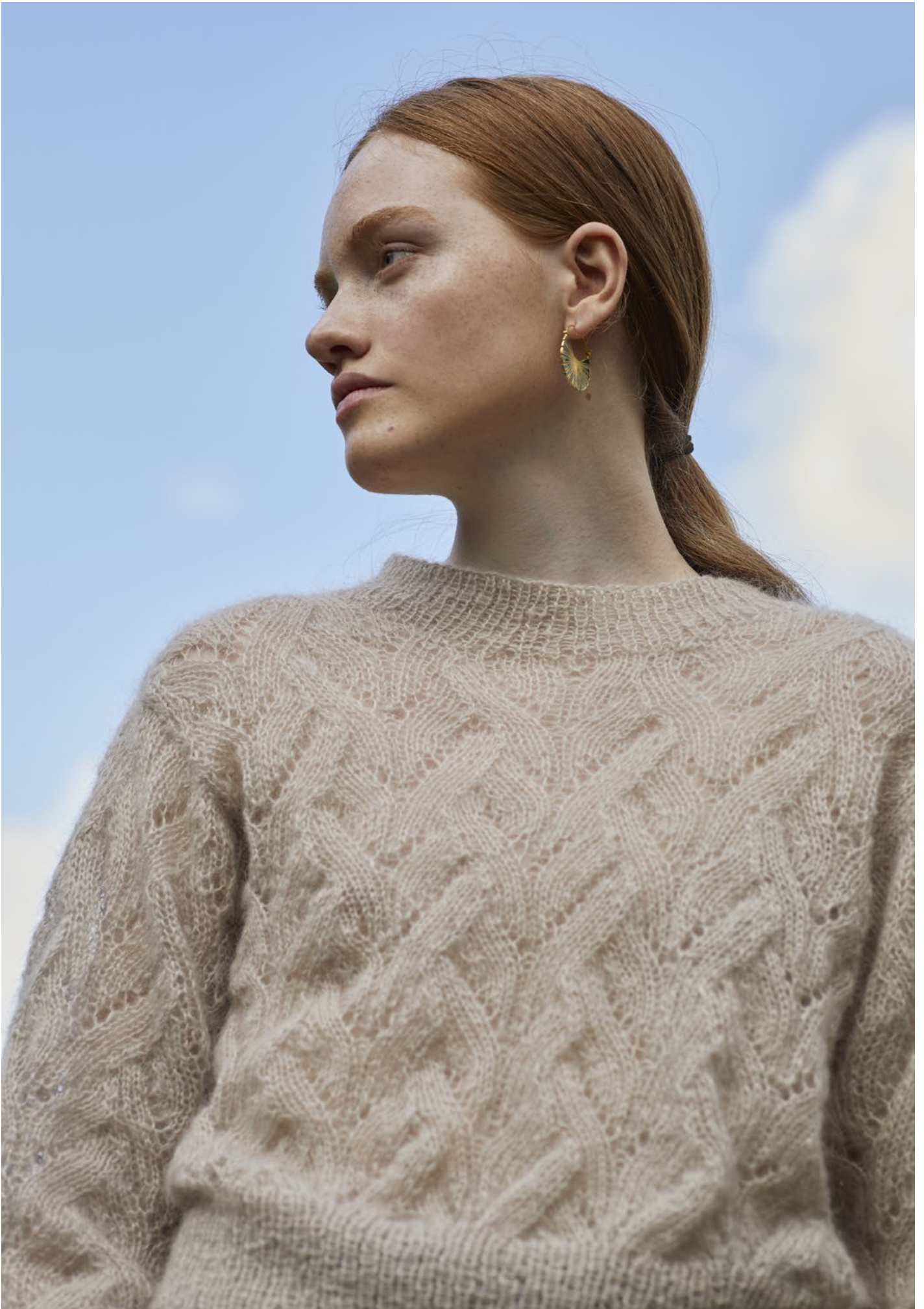
2 Fionagenser Plum lys beige 055