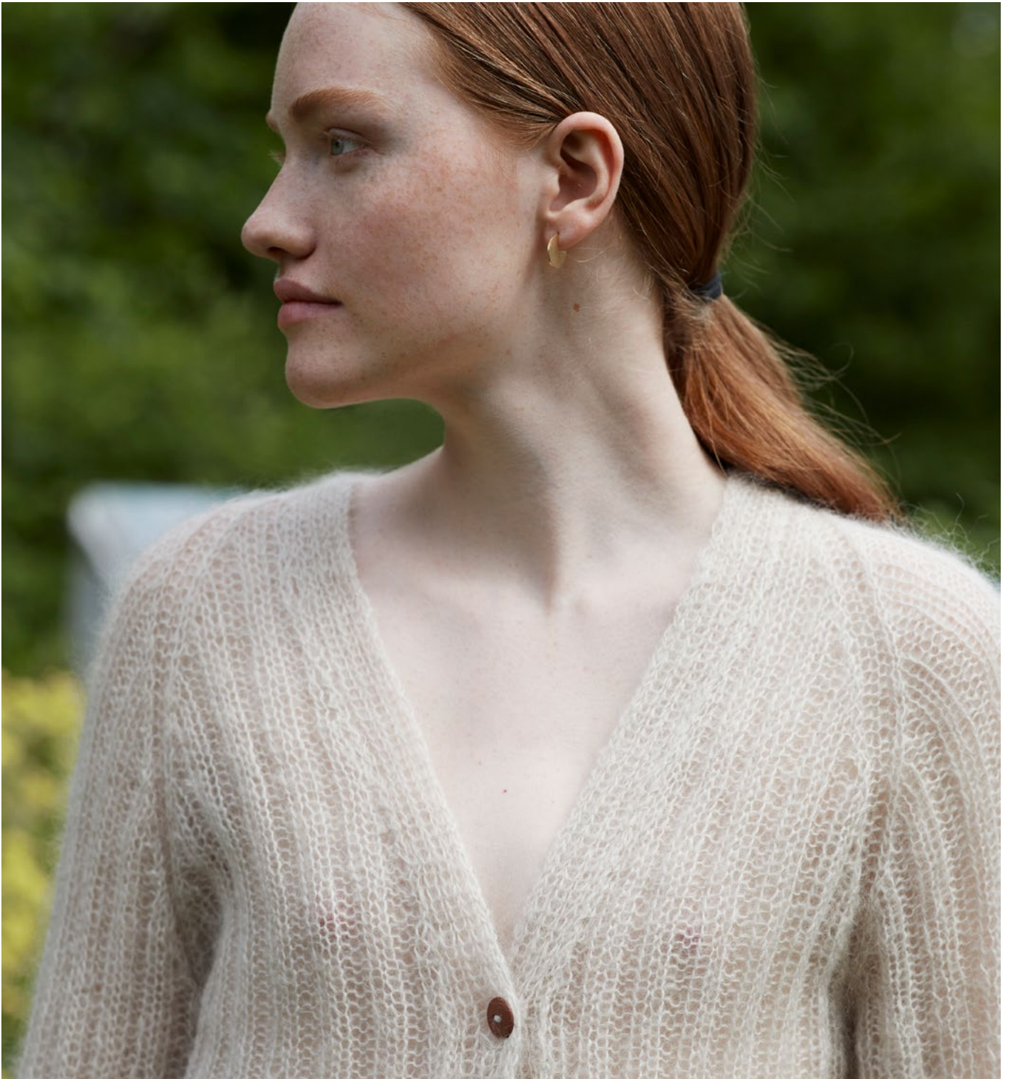
4 Adajakke Plum lys beige 055