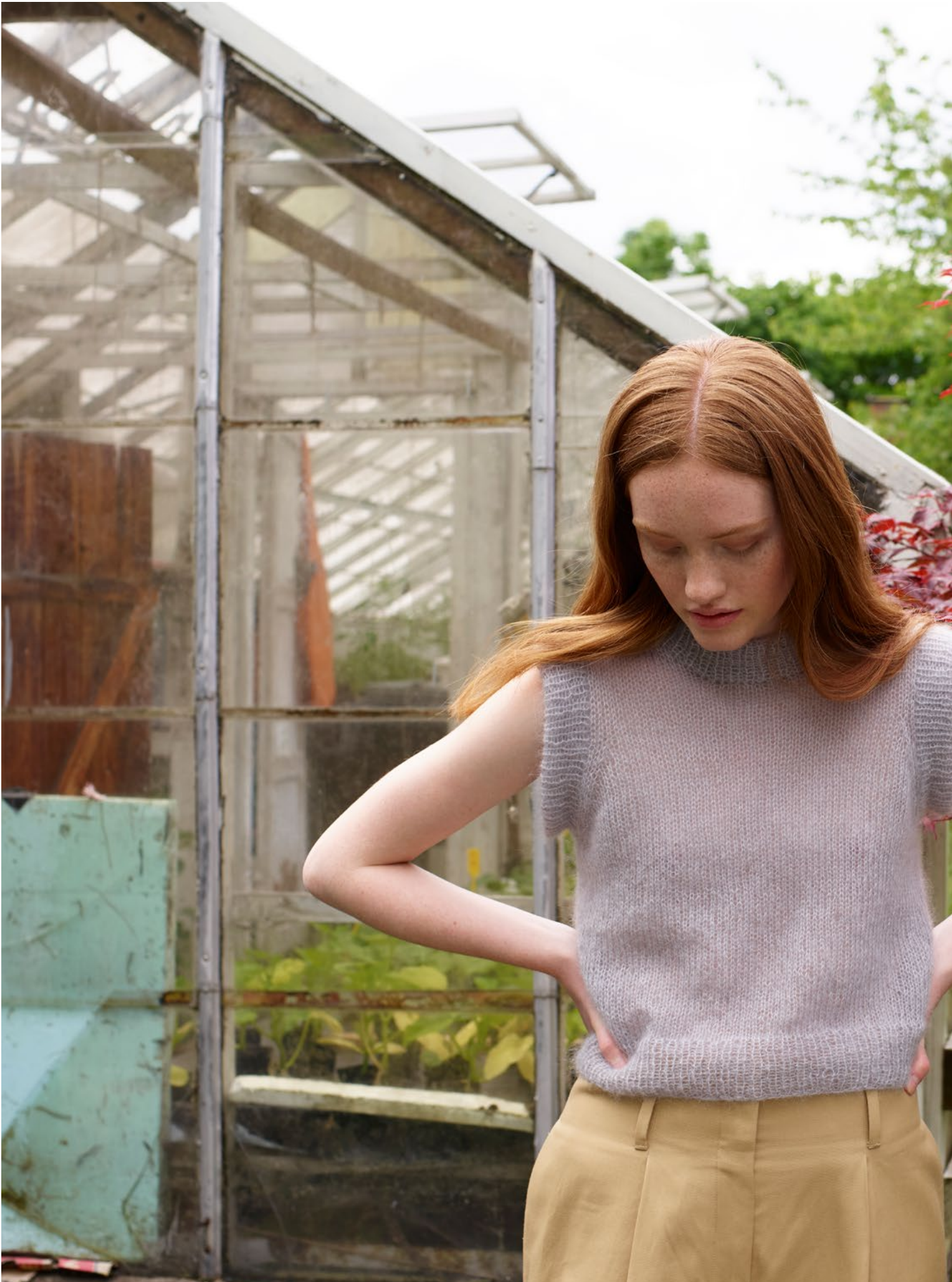
3 Sofiavest Plum lys grå 057