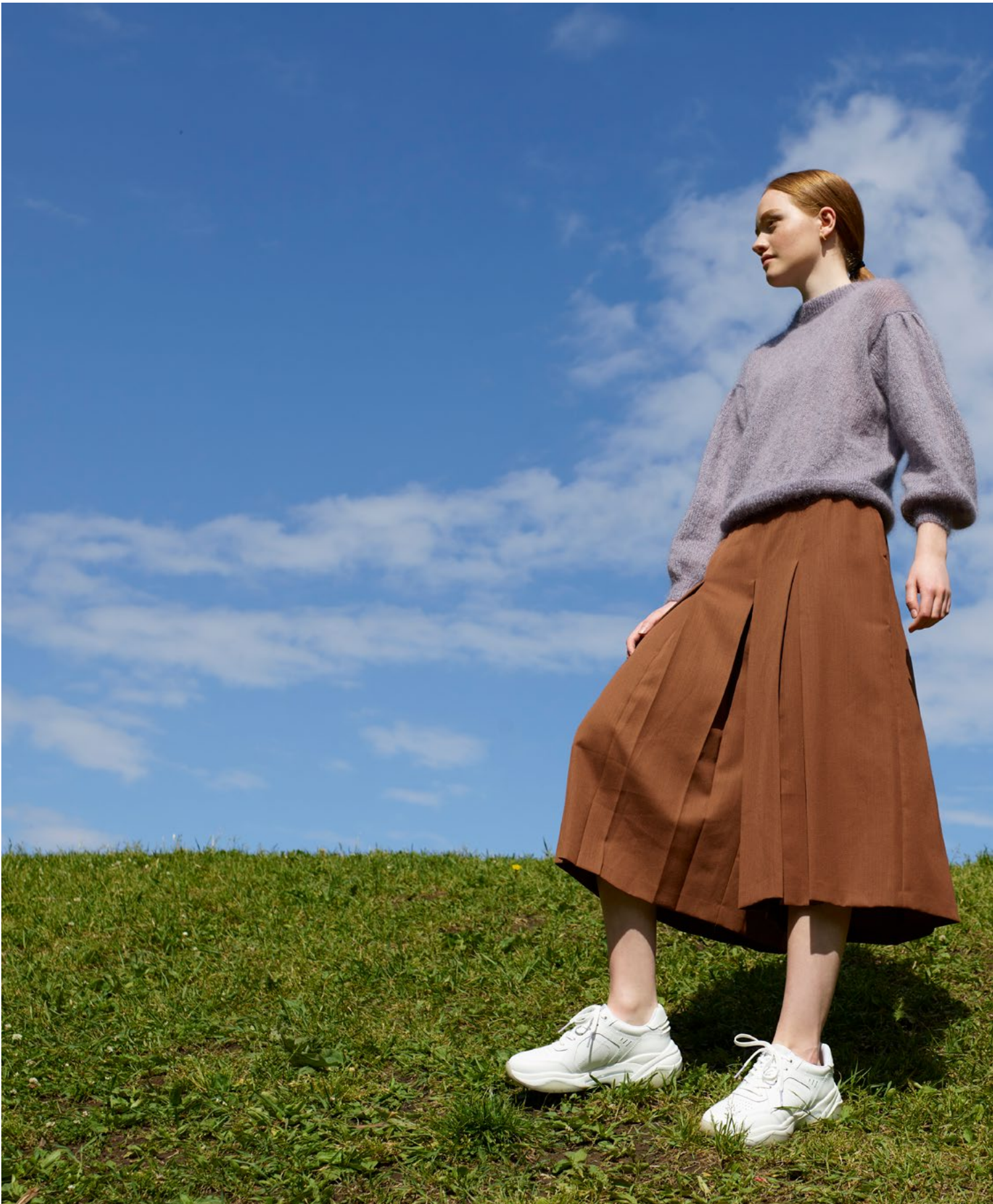
1 Celinegenser Plum lilla 048