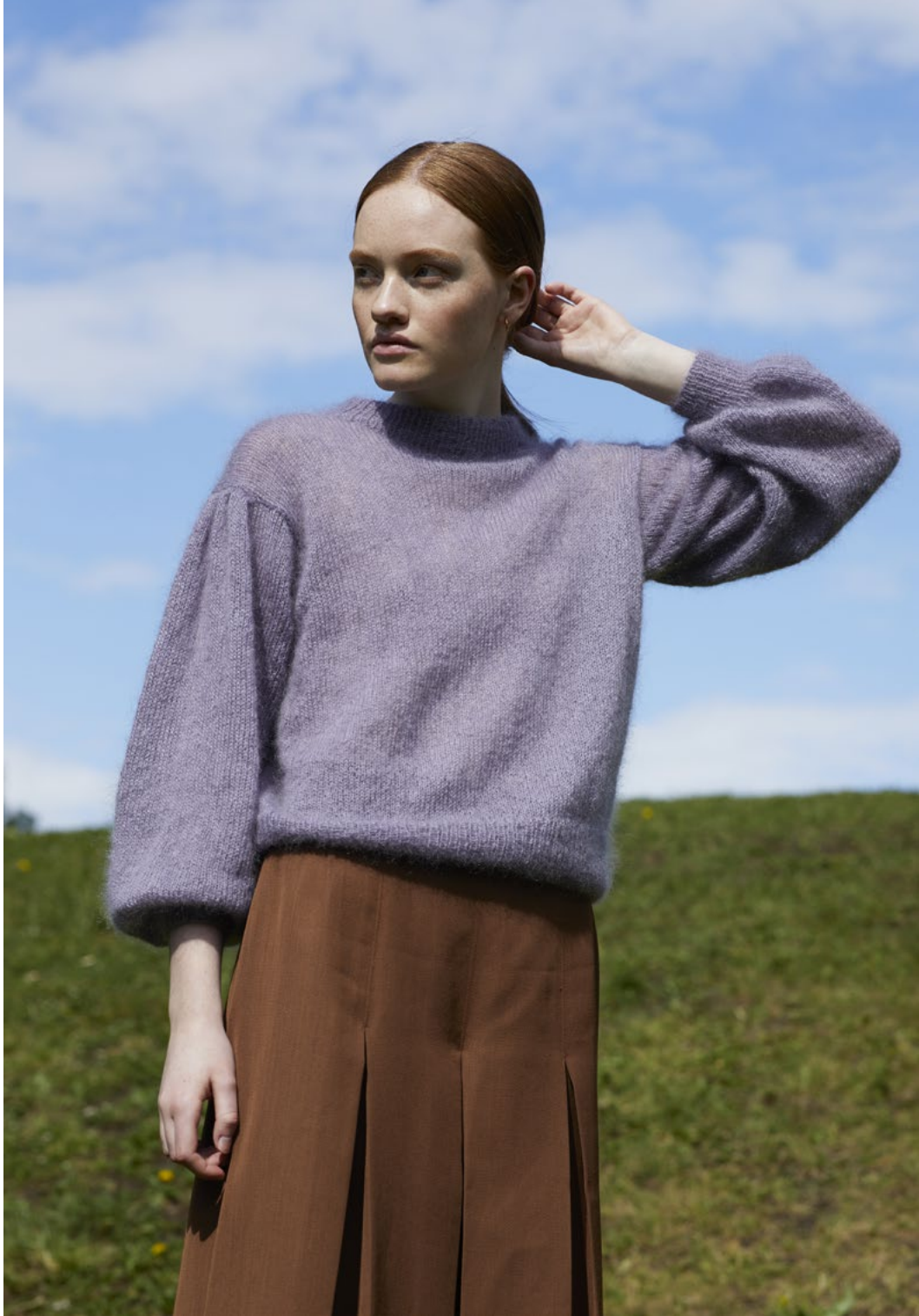
1 Celinegenser Plum lilla 048